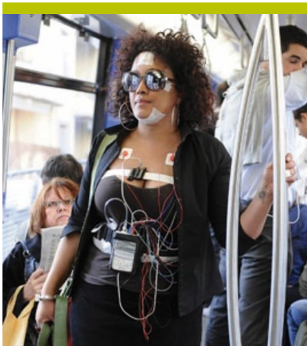
Figure 1. Une participante de l'étude HypnoLaus rentre dormir chez elle après avoir été équipée au centre du sommeil